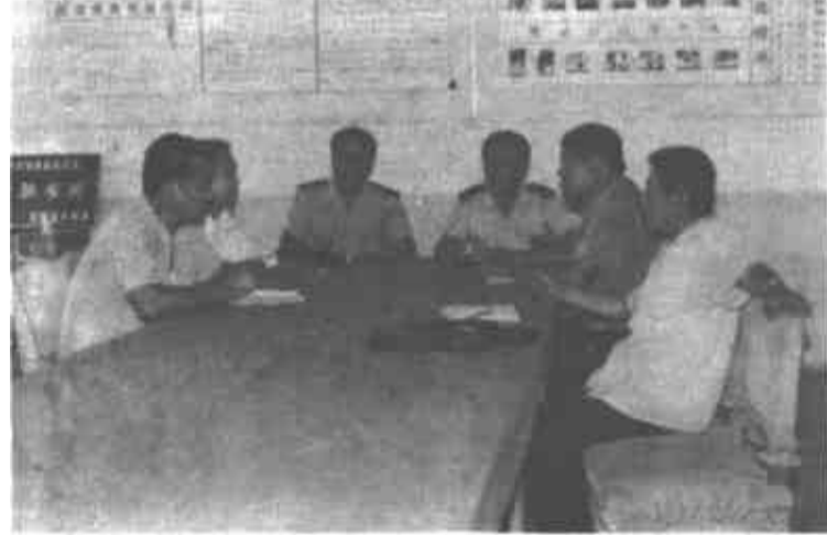
△图为局领导与有关人员研究促产增收措施。

垦利县税务局采取得力措施，狠抓促产增收工作，取得了明显成效。他们的主要做法：一是加强领导 狠抓落实。他们针对新形势下税收工作面临的新问题，充实了“促产办公室”人员，并制定了促产增收规划，建立了促产工作检查、考核制度，把促产工作列入岗位责任制范围，使“软任务”变成了“硬指标”，做到奖罚分明。